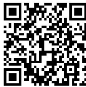
烟花爆竹经营（零售）