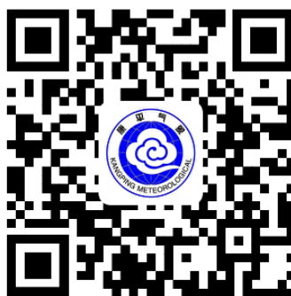
升放无人驾驶自由气球或者系留气球活动审批