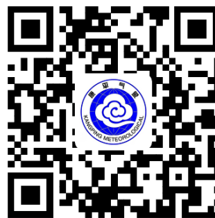
容缺办理事项清单