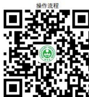
11. 放射性核素排放许可

② 网上办 :沈阳政务服务网: http://zfwf.shenyang.gov.cn/