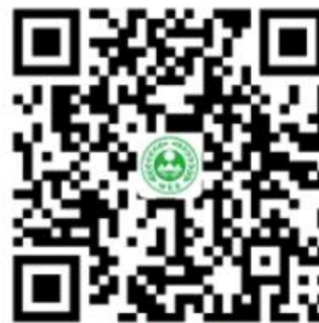
各政务服务大厅信息